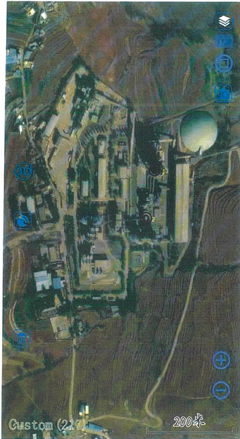
附件 1：检测点位示意图